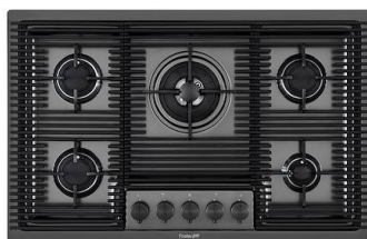
Placa de cocción Milanello Gun Metal 5F 7682 006