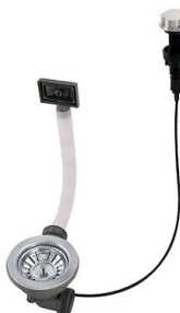
Desagüe automático 8407 100